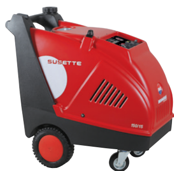
Quadro Elettrico 24 V 24 V Control Panel